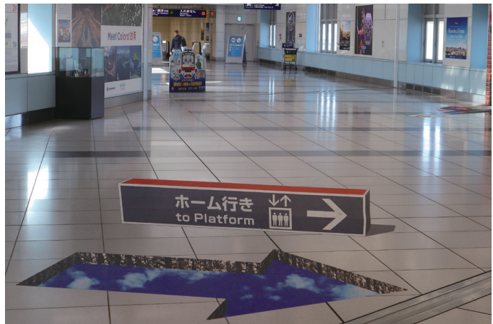
Fig. 4 京急空港線 羽田空港国際線ターミナル駅通路の案内サイン (2019年1月設置)