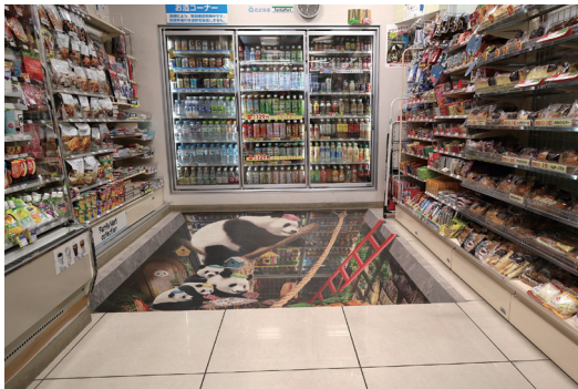
Fig. 3 西武池袋線 江古田駅のトリックアートコンビニ (2018年9月開店)