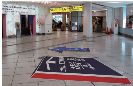
Fig. 5 反対側から見た案内サイン