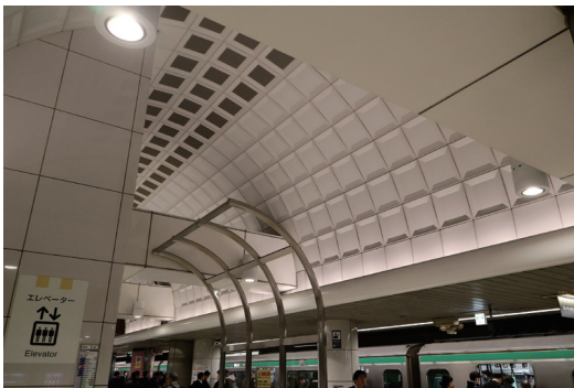
Fig. 2 りんかい線 東京テレポート駅の壁面 (1996年3月開業)