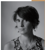
マルティナ・ パチガルポ 写真家/雑誌「6 MOIS」編集部